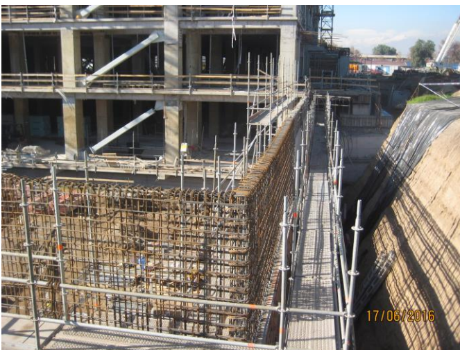
Avance muro perimetral sur poniente.