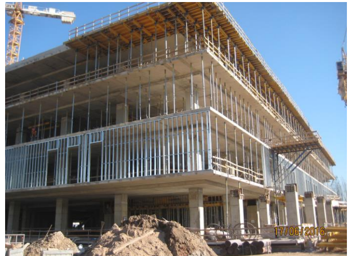
Vista fachada nororiente.