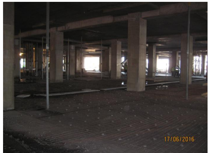
Vista parcial pavimentos piso 1.