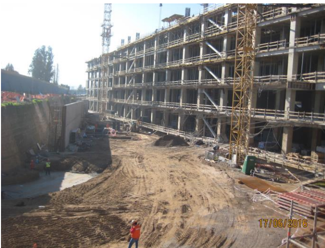
Radier patio camiones.