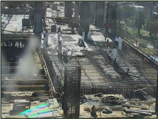
Vista parcial obra gruesa losa quinto piso.