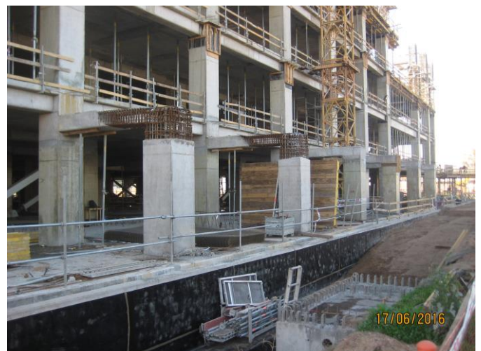
Impermeabilización Subterráneo -1